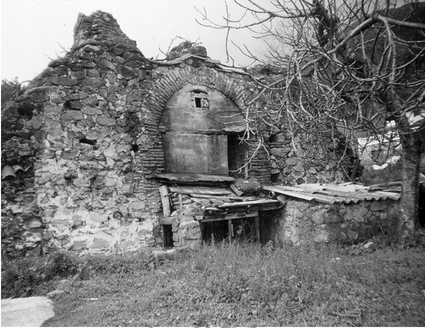
Restos de la ermita de San Juan, Lanzahíta ¿Siglo xv?

Ávila , una extensa franja territorial, en pleno Valle del Tiétar, que se extendía desde las sierras de Mijares y Gavilanes hasta la garganta de Santa María en Candeleda, por el oeste, y hasta el río Tiétar y la sierra de San Vicente, por el sur (27). Dicha concesión será fuente permanente de conflictos y desavenencias entre el nuevo titular, don Álvaro de Luna, y los concejos de Arenas y El Colmenar, afectando en particular esta controversia sobre deslindes y derechos de uso a Lanzahíta, cuyo término limitaba directamente con los alijares de Valdetiétar. Las primeras reclamaciones no se hacen esperar: ya en diciembre de 1432, procuradores del concejo de El Colmenar presentan sus quejas por haber tomado posesión indebidamente el representante de don Álvaro de ciertas pegueras y pastizales que pertenecían a los lugares de Las Torres y Lanzahíta; posteriormente en 1434, le recuerdan al nuevo señor que ambos lugares han pertenecido desde tiempo atrás a la villa del Barranco y que sus vecinos tenían comunidad de pastos y de aprovechamientos varios, en ca-