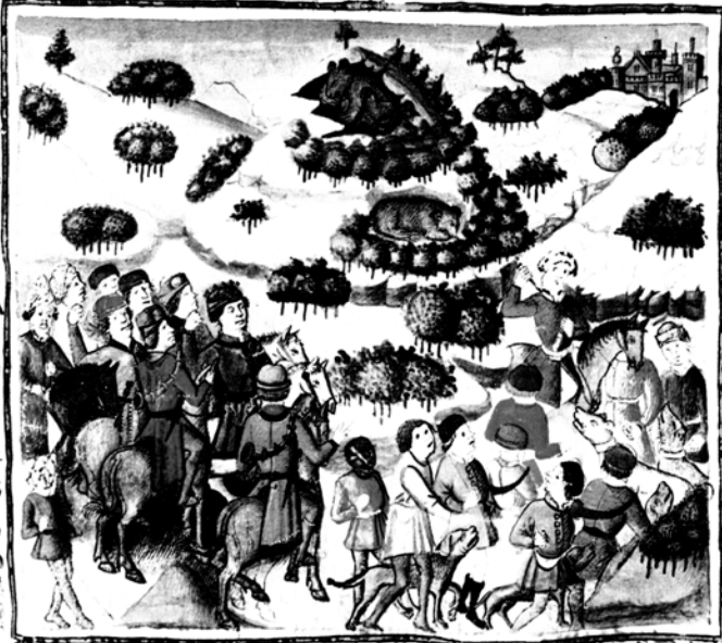
Miniatura del Libro de la Montería (Códice de Palacio). Caza de osos

dela oia de los martines. desy passaro por ella 7 fuezo adelante por la pda 7 fillaron q yua su paso. 7 desq' catenidicis en los canes q non era le vos la caua tiranlo la traxella abaxo 7 fuezo laduz ala ca ma en cima de la calva de billalua asomante al q'rigar. desy desce q' vieron q' lo ladiaua dieronle rddo los canes 7 alcançaronle luego 7 andodieris en el fasta medio dia. 7 fue moxi al canyo q' lo desce el q'rigar al lchpar q'nto accion de legua dela posada del q'rigar 7 por ser mas ciertos q' eia aql' onel q' auyamos andado ante dia. catenidicis le sy tenja alguna feyda 7 fallamos en el fiesto del azagaya con q' auyan dado ante dia. E por tal monterja omio esta prouimos nos q' quando abuen tenado sueltem 7 lo bien porfian temendo bueros canes no abra al sy non maturalle.