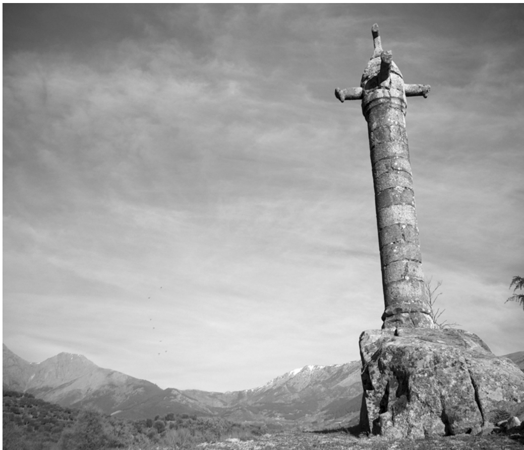
Cruz del Rollo (Mombeltrán). La vinculación jurisdiccional y territorial entre Lanzahíta y Mombeltrán se prolongará durante casi tres siglos (1393-1679)