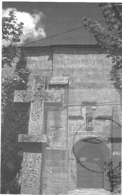
Vista de la iglesia parroquial de Lanzahíta