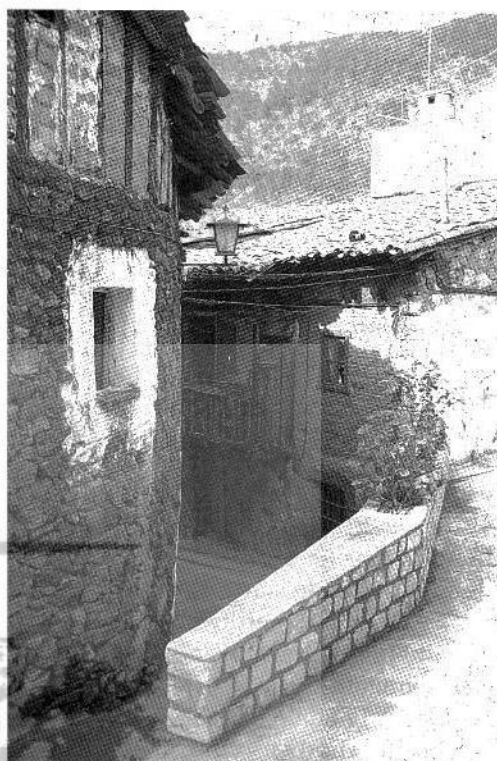
Arquitectura popular de Mijares

En los últimos años de la centuria el señorío de Mombeltrán fue afectado por la epidemia de peste. En la carta de los corregidores de Ávila al rey el 30 de junio de 1599 se indicaba en cierta medida