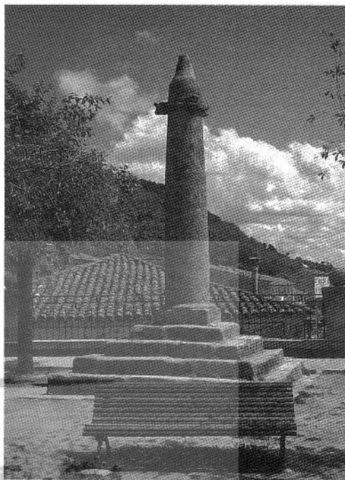
El rollo de Pedro Bernardo, insignia jurisdiccional de la villa