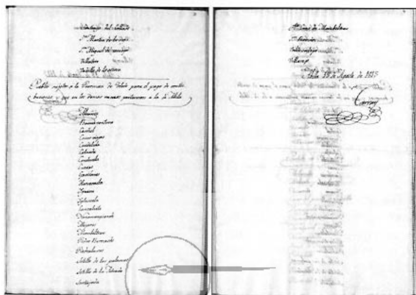
Lista de los pueblos que han certificado la instalación de ayuntamientos constitucionales

en todos los pueblos del antiguo señorío de Mombeltrán, con la excepción de San Esteban (en esta lista, Serranillos aparece en el Partido de Ávila). En cualquier caso, como hemos comentado anteriormente, el 16 de mayo se habían elegido en San Esteban nuevos alcaldes, nombrados con arreglo a la Constitución. Parece, pues, que sólo les faltaba enviar la documentación correspondiente.