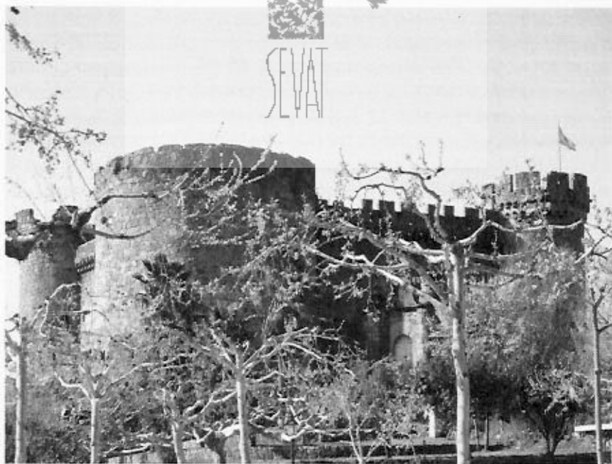
Vista actual del castillo de Mombeltrán.