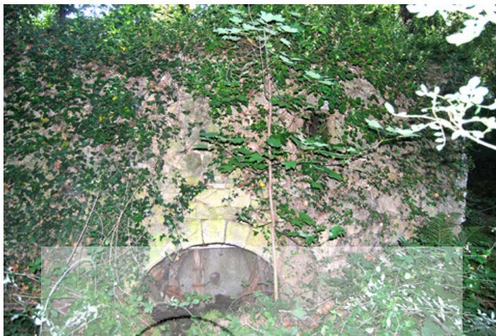
Ruinas del molino del Labradero en la garganta de las Torres