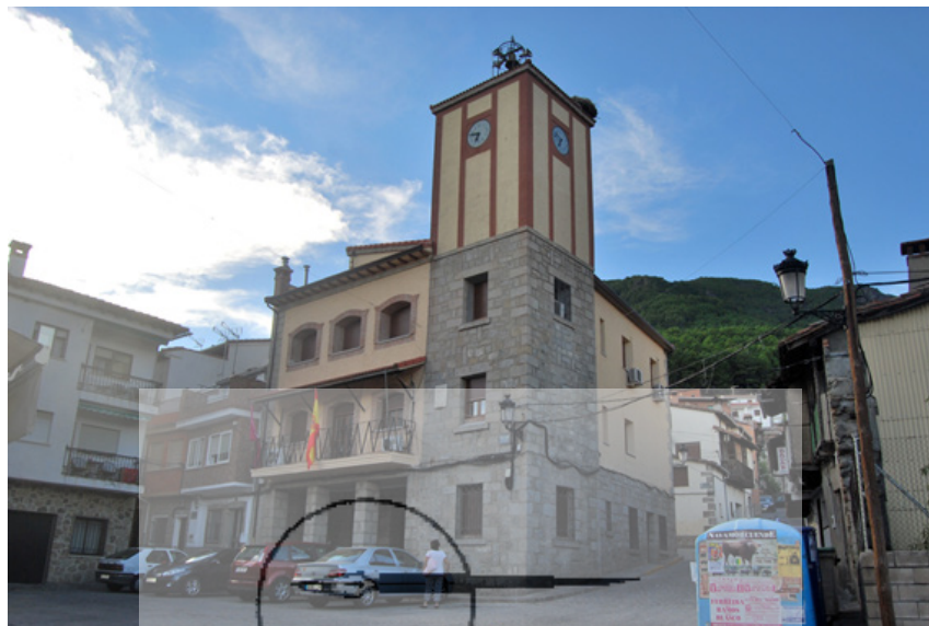
Actual Ayuntamiento de Gavilanes

Los antiguos escribanos, parte de cuyas atribuciones vienen desempeñadas por los actuales notarios, eran de diversas clases. Los escribanos de cámara asistían a las Salas de Audiencias o de Tribunales Supremos, para extender autos, decretos, etc. Los escribanos reales podían ejercer su función en todo el reino, excepto en donde hubiera numerarios. Los escribanos numerarios o del número podían actuar sólo en la circunscripción (población o distrito) en la que estaban asignados, con exclusión de los demás. Finalmente, los escribanos de Ayuntamiento se encargaban de levantar acta de las sesiones de Ayuntamientos o Concejos.