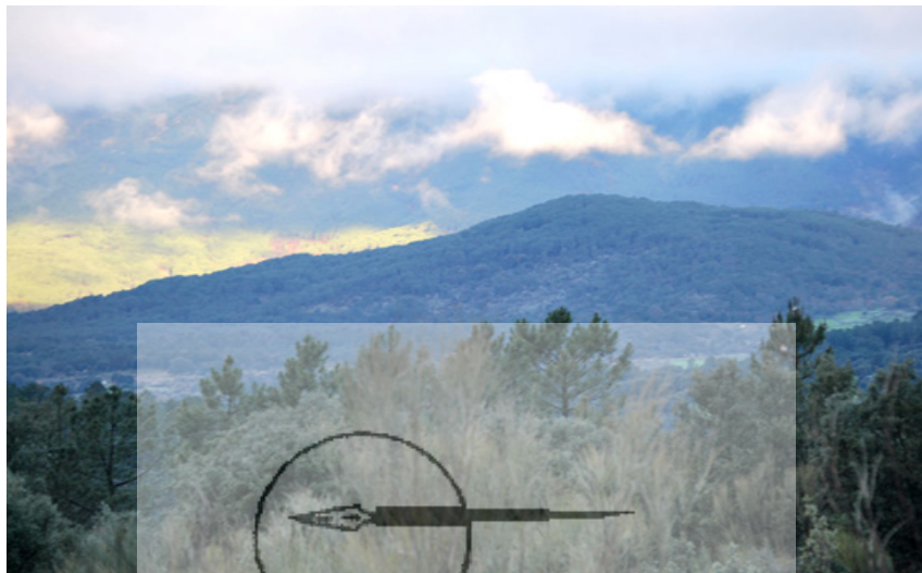
Vista del cerro de La Pinosa, actualmente en término de Mijares

tenía su cuartel en la Pinosa, frente a Gavilanes 15 .