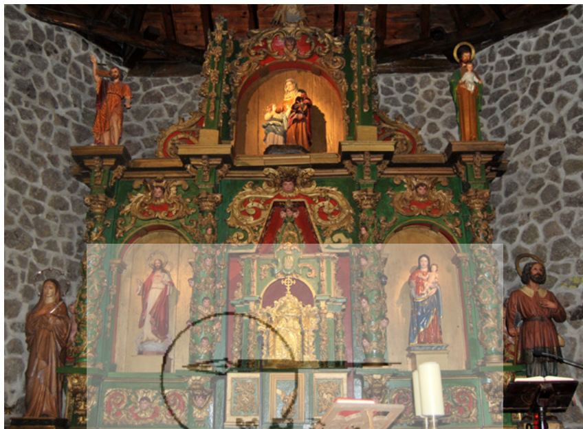
Retablo en la Iglesia de la parroquia de Santa Ana de Gavilanes