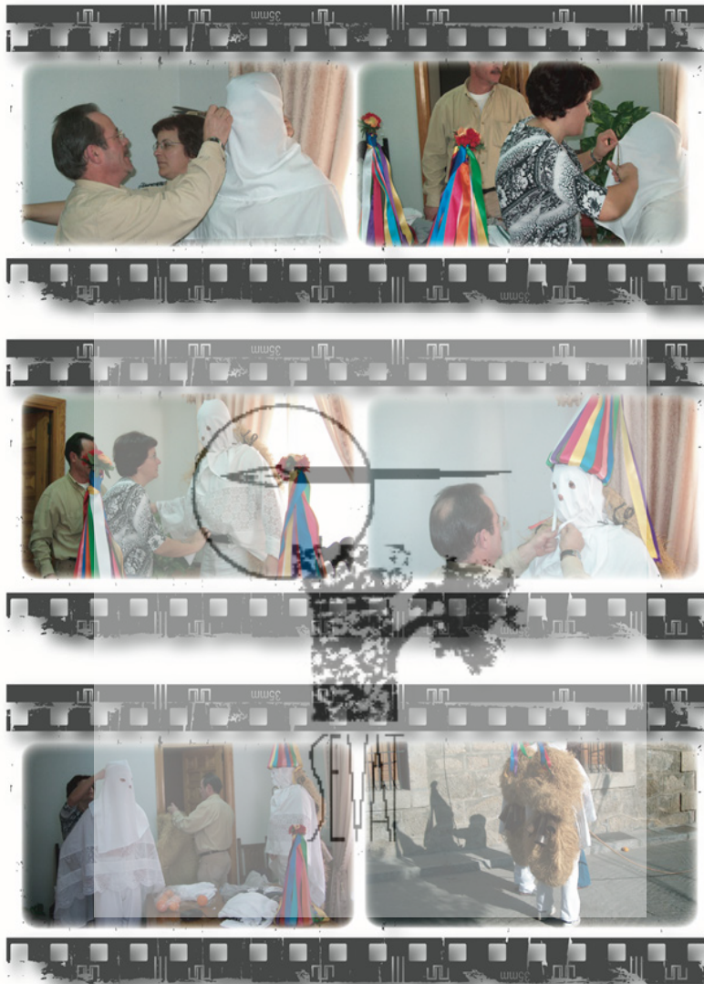
Figura nº4. La preparación de los Zarramaches en el ayuntamiento de Casavieja (2004) con el apoyo de empleados municipales