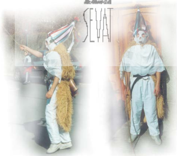
Figura nº2. Dos imágenes de los Zarramaches en los albores del siglo XXI (año 2001).