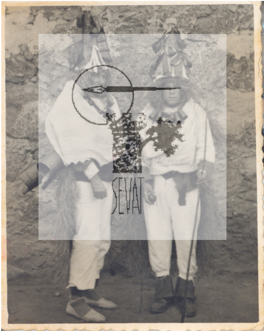
Figura nº1. La memoria visual de los Zaramaches (posiblemente hacia 1960-1965).