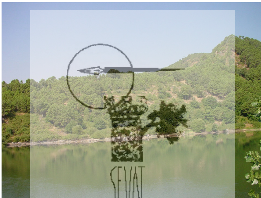
Panorámica del castro junto a la Presa del Pajarero

Los castros son lugares de habitación amurallados utilizados por diversas tribus prerromanas, entre ellas las de los vettones habitantes de las tierras de Cáceres, Avila, Toledo, Salamanca, Badajoz y Portugal. El vettón es un pueblo antiguo de sustrato celta.