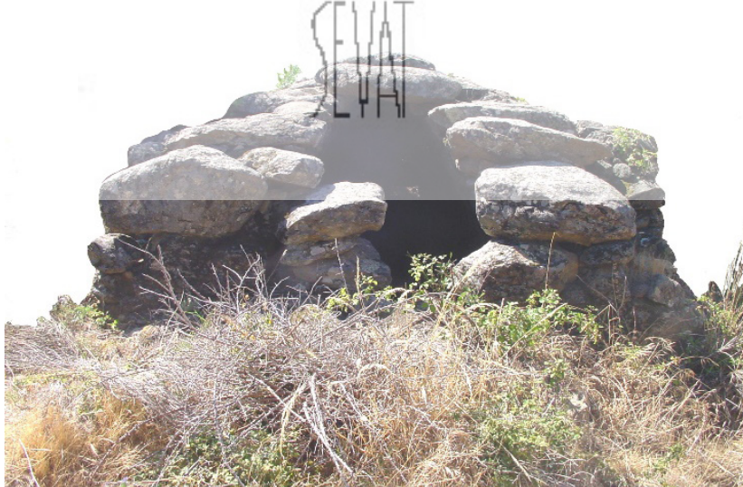
Zahúrdas de La Cancha

Al lado del castro se encuentran las Zahúrdas de La Cancha, construcción pecuaria de formas megalíticas, aún en buen estado de conservación, y a izquierda y derecha de la estrecha garganta del Pajarero se hallan los restos arrumbados de varios molinos –molinos de La Vega, El Cubo, Las Callejas, La Rosa, La Charquilla, La Máquina, El Venero–, con vestigios de piedras, caces y rodeznos.