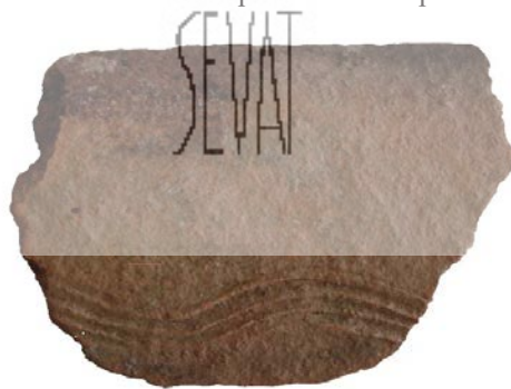
Cerámica con decoración a peine hallada en el castro

La cubierta está, pues, muy alterada por la maleza y el pinar, no abundando los restos en superficie, donde pueden observarse algunas cerámicas comunes de pasta rojiza y parda, de difícil datación por su persistencia cronológica. Destacan algunos fragmentos localizados in situ que presentan una pasta naranja basta, cocción oxidante con desgrasantes gruesos y decoración a peine, característicamente vettona, aunque asimismo de dilatada persistencia. Algunas personas del pueblo afirman haber encontrado en la zona monedas tardo-republicanas, pero esta comunicación personal no ha podido ser corroborada.