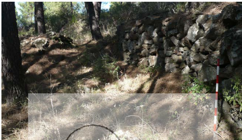
Restos de la muralla del castro de Escarabajosa, aún visibles a día de hoy

La cubierta está, pues, muy alterada por la maleza y el pinar, no abundando los restos en superficie, donde pueden observarse algunas cerámicas comunes de pasta rojiza y parda, de difícil datación por su persistencia cronológica. Destacan algunos fragmentos localizados in situ que presentan una pasta naranja basta, cocción oxidante con desgrasantes gruesos y decoración a peine, característicamente vettona, aunque asimismo de dilatada persistencia. Algunas personas del pueblo afirman haber encontrado en la zona monedas tardo-republicanas, pero esta comunicación personal no ha podido ser corroborada.