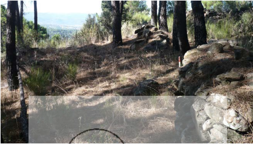
Restos de la entrada en esviaje al castro

El castro ocupa algo menos de tres hectáreas [2,8 ha aproximadamente], con unos 300 metros de largo y 100 metros de ancho máximos; se orienta según el tajo de la garganta en dirección NNO – SSE. La cota sobre el nivel del mar es de 800 metros en el sur y 820 metros en el lado norte, que asciende en escarpe hacia el Canto de la Mora (980 metros). El nivel del embalse se halla a unos 770 metros