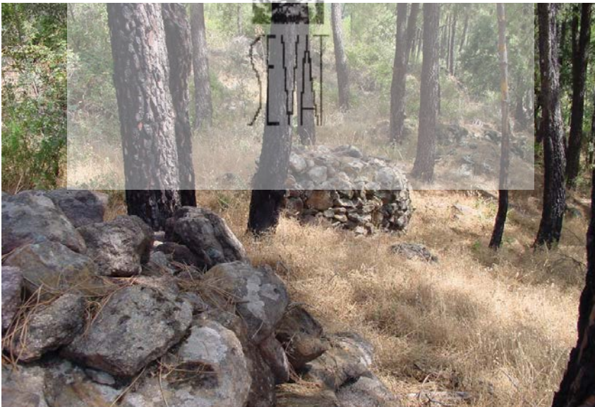
Algunos segmentos de lo que fue el lienzo de muralla con entrada en esviaje

El castro ocupa algo menos de tres hectáreas [2,8 ha aproximadamente], con unos 300 metros de largo y 100 metros de ancho máximos; se orienta según el tajo de la garganta en dirección NNO – SSE. La cota sobre el nivel del mar es de 800 metros en el sur y 820 metros en el lado norte, que asciende en escarpe hacia el Canto de la Mora (980 metros). El nivel del embalse se halla a unos 770 metros