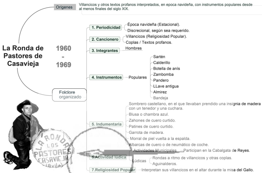
Figura nº 4. Diagrama resumen de las características de la Ronda de Pastores de Casavieja (1960-1969).