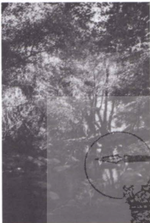
La garganta de Las Torres

nanzas indicaban que "... Esto no se entiende en cuanto al pasto con los bueyes de labor de los lugares de los Mijares, Gavilanes y Torres desde primero de abril hasta ser cogido el pan por ser tierra de poca hierba en su distrito".