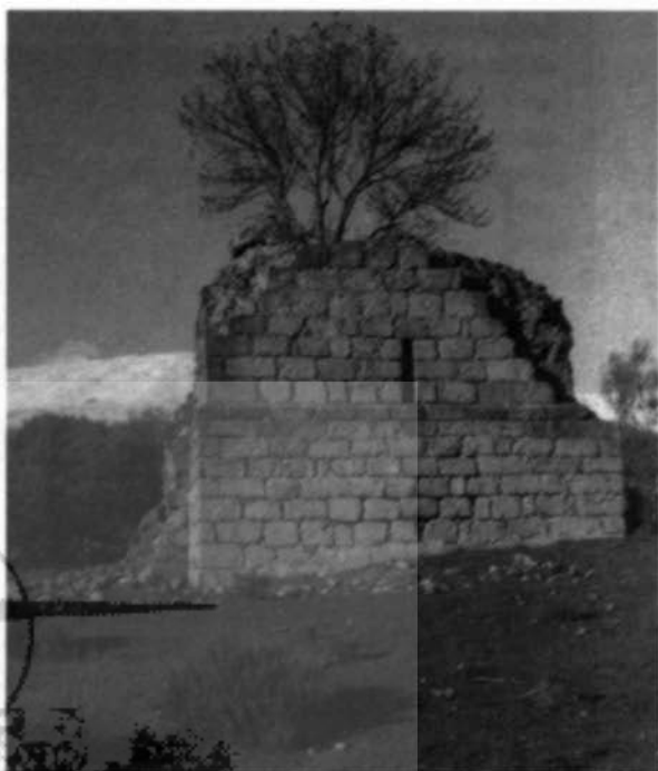
Cara sur de la torre-iglesia del despoblado de Las Torres

En el siglo XIII existían pocas poblaciones en el Alto Tiétar; relación que podemos encontrar en la Consignación de rentas del obispado abulense promovido por el cardenal Gil Torres, donde en 1250 5 aparecen La Adrada, Las Torres 6 y Lanzahíta. A partir de esa fecha 7 el proceso poblacional presentará un asentamiento definitivo, con ciertas perspectivas de auge en los siglos venideros, que irán observando la creación de nuevas entidades demográficas. La explotación de los recursos del entorno y el aprovechamiento de los pasos naturales fueron inicialmente claves; el Valle del Tiétar ofertó las condiciones apropiadas para el desarrollo de una pequeña minería, agricultura/ga-