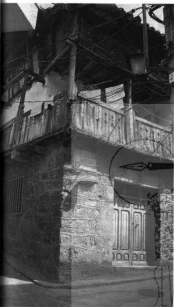
Arquitectura popular de la villa de Mijares

gaba 4.000 reales por Alcábalas, de diezmos 700, por la Aprobación de Justicia (Impartición) unos 120 y otros tanto como regalo al duque de Albuquerque. Además, se elaboró una lista con los precios de los productos agrícolas y se estimaron los ingresos referentes a monte pinar y de roble, así como de labrar pez (800 reales). En el tema de impuestos, de todos los pro-