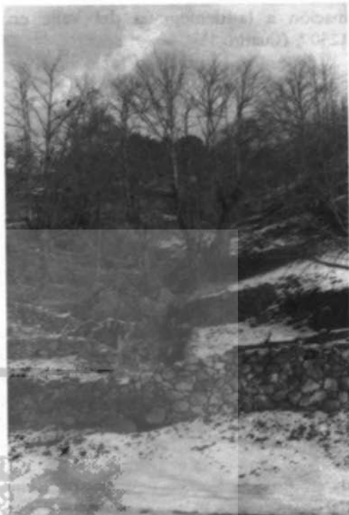
Paisaje invernal de Mijares

jares, destacar la contemporánea investigación del Dr. Chavarría, que aporta información al respecto 20 : "Responde simplemente a un plural romance —campos sembrados de mijo— mijares". Aunque cabe tener en cuenta la intuición sobre dicho origen aportada por Palomino y Tosas en su tesina de licenciatura 21 . Está documentada la presencia de cultivo de mijo en el Estado de la Adrada en 1500, como puede deducirse de la prohibición de su siembra