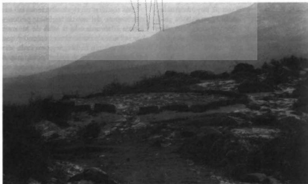
Antiguas eras de trilla en Mijares

Destaca, además, en la delimitación la afirmación que aporta sobre la situación histórica de su vecina población: «Esta la situación del lugar de Gavilanes y casi todas sus heredamientos por averse fundado en esta jurisdicción pedánea de esta villa siendo aldea, y no les esta concedido mas jurisdicción que el utilizamiento y cercado cruces desde su fundación y oi se mantiene devajo de los amojonamientos y asimismo en las 70 peonadas de prado tienen los vecinos desta villa son las 10 peonadas de la fabrica de la yglesia y algunas capellanías...Se tienen pastos comunes para los ganados de todas las villas y lugares del estado de Mombeltrán que por no ser suficientes estos pastos comunes se buscan otros fuera de esa comunidad para la manutención de los dichos ganados...Por quanto el que se denomina despoblado de las Torres se alla en la jurisdicción de la villa de Mombeltrán sin tener en dicho