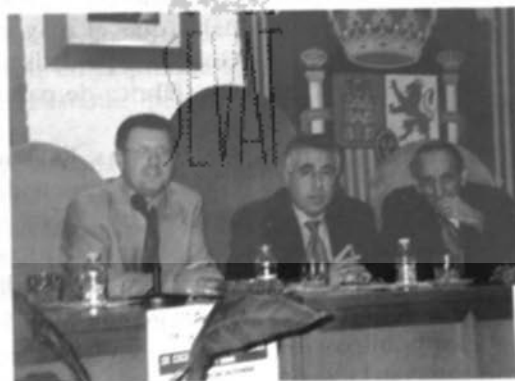
Conferencia celebrada el 7 de noviembre de 1998 en el Salón de Plenos del Ayuntamiento de Sotillo de la Adrada

Los volúmenes dedicados a la transcripción de Las Respuestas Generales de las más importantes villas y ciudades castellanas —en la colección Alcábalá del Viento editadas por Tabapress— incluyen interesantes introducciones de destacados especialistas en Historia Moderna. Los que más interesan por su proximidad son los números 28 (dedicado a Arévalo, introducción de Angel Cabo Alonso), el 50 de Navas del Marqués (introd. de Gonzalo Martín García y Concepción Camarero) y el 52 de Avila capital con introducción de Nicolás Sánchez-Albornoz y Aboín.