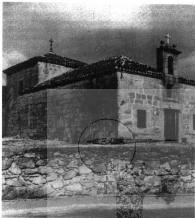
Ermita de la Virgen de los Remedios. Imágenes de un siglo . E. García Fernández