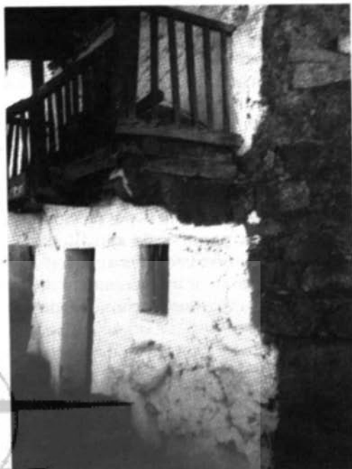
Rincón sotillano. Imágenes de un siglo. E. García Fernández

Los trabajos en el viñedo eran numerosos y se extendían a lo largo de todo el año. Se podaba a finales del invierno, al mismo tiempo se excavaba. Acabada la poda se practicaba una labor de cava en-