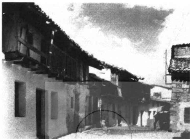
Calle sotillana de Las Parras. Imágenes de un siglo. E. García Fernández

Arenas de San Pedro en el ámbito de la diócesis de Avila. Y se mantenía una relativa relación de dependencia respecto de la Abadía de Burghondo.