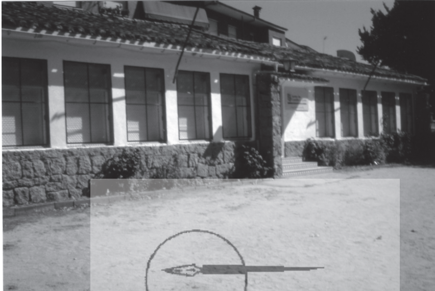
La Parra, Colegio Público "Arturo Duperrier"