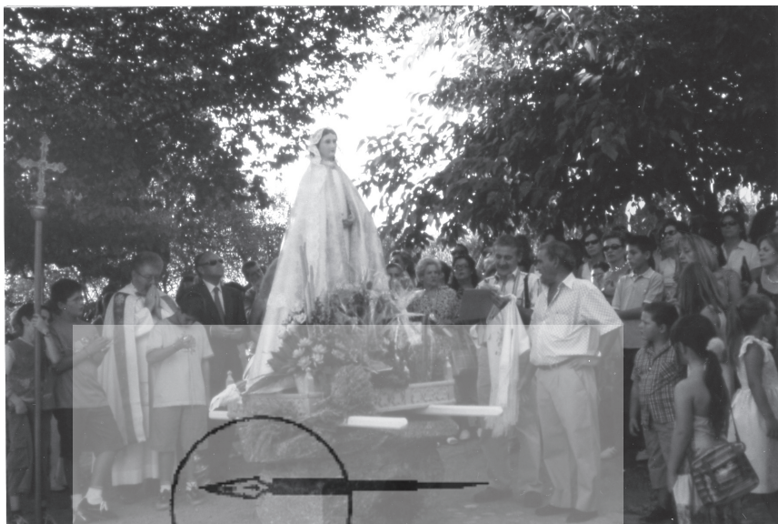
La Parra. Subasta de banzos en la fiesta de la patrona, Nuestra Señora de la Asunción

huertos y cercas de regadío el pie para hortaliza y verde no se puede considerar fruto determinado por ser arbitrio de los dueños el cultivar las distintas especies, valoraron la utilidad que puede dar cada fanega de tierra en setenta reales de vellón al año Y en las cercas de secano tanto en la tierra sobrante, que no ocupan los árboles, como en las que se siembran de verde no pudiéndose igualmente considerar fruto determinado, valoraron el producto de cada fanega, según su calidad los usos que los dueños pueden hacer de ella por veinticinco reales de vellón al año.