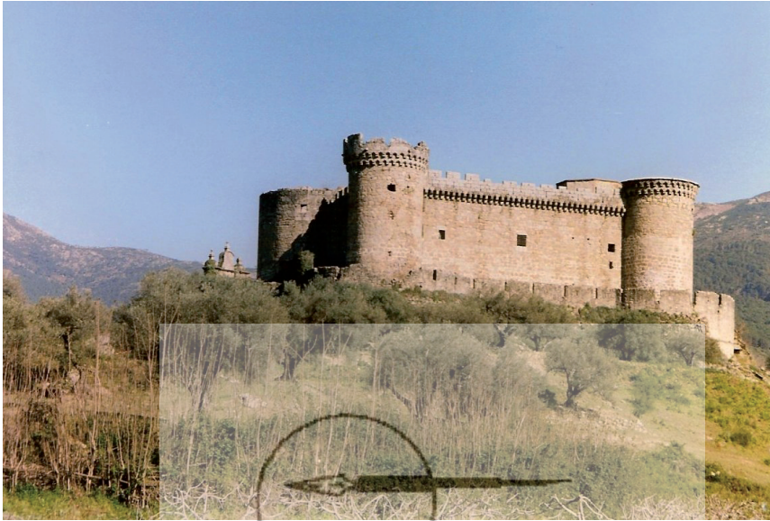
Vista del castillo de Mombeltrán.

na, convierten a la fiscalidad señorial en la más importante de las que soportan los pueblos de señorío.